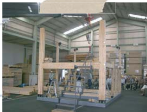
過去の見学会開催時の様子

体感会なので、多くの参加者様 に建て方も体感頂いております。 躯体が組みあがれば勿論その上 にも登って頂けます！ クレーン車を使っての建て方実演 は迫力満点！